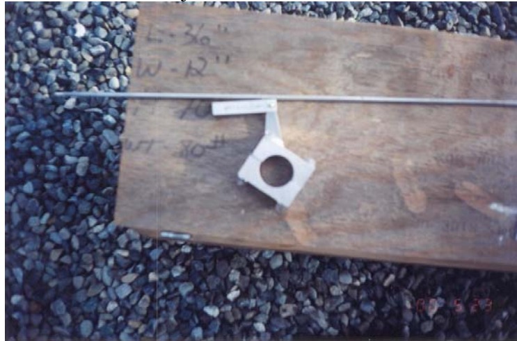
Ensamblaje de enlace usado con el kit